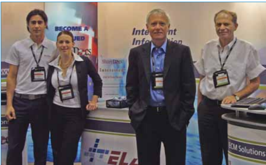
המשלחת מבית אלעד בכנס השותפים העסקיים של מייקרוסופט בבוסטון

ההצלחה בישראל עם שותפים מכל העולם. למען האמת, התגובות הנלהבות של המבקרים בביתן הפתיעו אפילו את האופטימיסטים שבינו. לא ציפינו לרמת התעניינות כה גבוהה, אך נראה כי רמת הבשלות של המוצר, רוחב הפיתרון שהוא מספק ועשרות סיפורי ההצלחה של לקוחות עשו את שלהם ולמעלה מ-120 חברות מארבעים מדינות שונות הביעו התעניינות במוצר וחלקם אף הביעו כוונה ראשונית ליישמו בארצם.